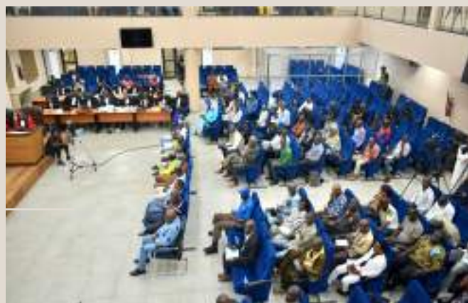
Le tribunal de première instance de Dioïnn délocalisé à la cour d'Appel de Conakry - salle d'audience.

et internationales. La publicité des audiences permet au public d'assister aux séances, garantissant la transparence du processus ainsi que le principe du débat contradictoire, assurant à chaque partie l'opportunité de présenter sa cause.