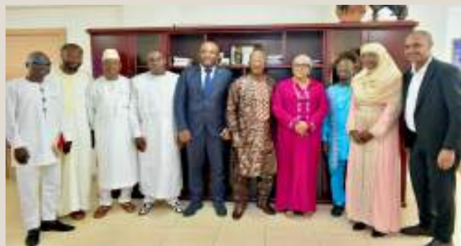
Rencontre entre le Représentant OMI Droits de l'Homme et Monsieur le Ministre de la Justice et des droits de l'Homme.

Le 6 novembre, à la recherche des fugitifs et des assaillants, les forces spéciales en grand nombre avec plusieurs pick up et deux chars, selon les témoins, ont toqué au portail d'une usine située au quartier Coléah. Le gardien de l'usine ne se serait pas empressé d'ouvrir la porte. Au moment où il a ouvert le portail, les éléments des forces spéciales l'ont giflé, l'accusant d'avoir retardé à ouvrir la porte. Selon les témoins et la victime elle-même, les militaires l'ont allongé par terre, et lui ont pointé le fusil sur la tempe. Par la suite, ils ont commencé à le piétiner étant déjà à terre, avec leurs bottes, causant ainsi son évanouissement pendant un long moment. Au moment de l'entretien, il a été constaté un pensement autour de sa poitrine et son ventre.