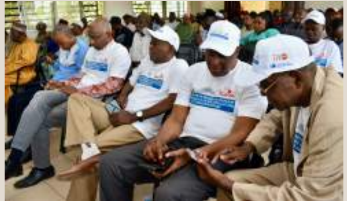
Cérémonie de lancement de la première phase de la campagne de réconciliation nationale à Lissan.

une meilleure compréhension de la gouvernance et des priorités du gouvernement; la récurrence des problèmes liés à la sécurité en milieu urbain, rural ; et enfin la problématique de l'indépendance, l'impartialité de la justice et à la lutte contre l'impunité.