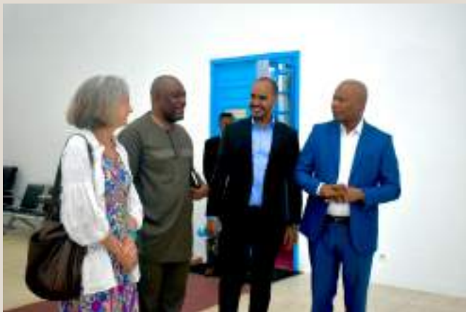
Rencontre entre le Représentant OMI Droits de l'Homme et le Président de la Haute Autorité de la Communication.

Toujours dans la série de mesures de restriction, certaines télévisions ont été retirées de bouquets Canal+ et Startime pour motif « sécurité nationale ». En effet, le 6 décembre 2023 le Président de la HAC a adressé un courrier au directeur de Canal+ international en Guinée de retirer « sans délai » Djoma FM et Djoma TV de son bouquet pour « raisons de sécurité nationale ». et sans préavis ni notification à leurs responsables.