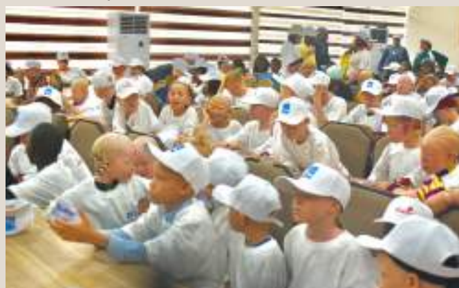
Journée Internationale de Sensibilisation à l'Albinisme.

En outre, le HCDH a assisté techniquement le ministère à la promotion féminine, enfance et personnes vulnérables dans l'identification des axes stratégiques pour la révision de son système de protection de l'enfance en Guinée.