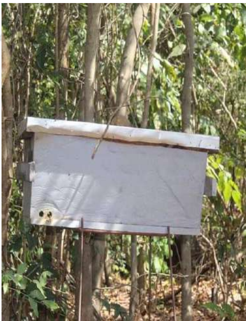
Le GOHA INTERNATIONAL s'investit dans l'apiculture