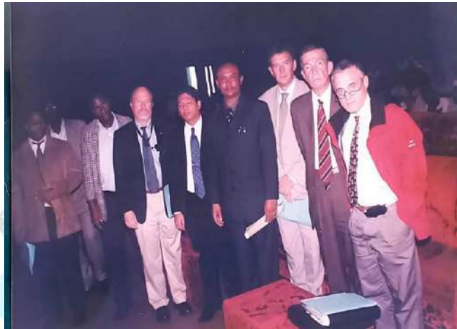
Remise du rapport relatif aux victimes de pillages au palais du peuple