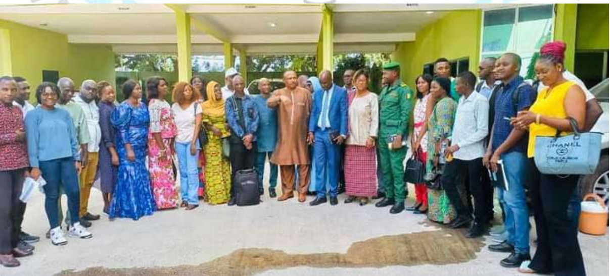
Le Président du GOHA INTERNATIONAL avec les cadres de la direction nationale de l'assainissement et du cadre de vie pour une dynamique assainissement des marchés