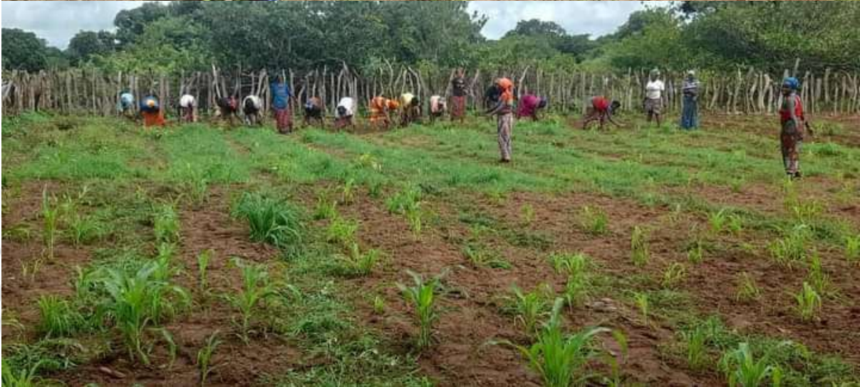
Un groupe de femmes de Sarebhoidho, sous l'impulsion du Président du GOHA INTERNATIONAL, s'est engagé dans le maraîchage