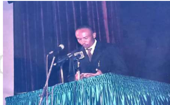
Bénédictions du Président du GOHA INTERNATIONAL

En 2009 : Des bénédictions par le Président du GOHA INTERNATIONAL, après la conférence organisée par le GOHA INTERNATIONAL sur la promotion et la sécurisation des investissements en Guinée au palais du peuple sous la présidence du Capitaine Moussa Dadis Camara