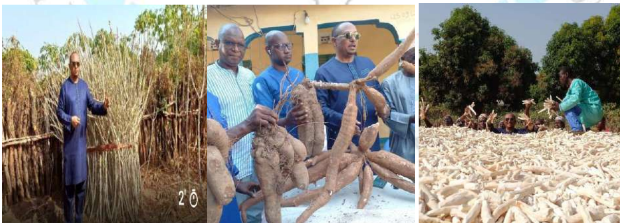
Le Président du GOHA et certains opérateurs économiques essaient l'agriculture pour satisfaire aux besoins des populations en nourriture

Certains commerçants et opérateurs économiques ont déjà commencé à s'intéresser au secteur agricole, des coopératives sont en gestation pour de grands investissements dans le domaine agricole. Ce sont les incendies criminels volontaires récurrents des dernières années dans les champs et plantations des particuliers qui ont poussé les opérateurs à la retenue, jusqu'à ce que l'Etat prenne des dispositions pour freiner ce phénomène décourageant.