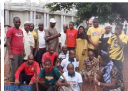
Signature d'un partenariat avec la direction nationale de l'assainissement et du cadre de vie ; le GOHA en plein assainissement des marchés et lieux de culte