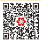
Le code QR d'inscription pour les acheteurs étrangers

Afin d'améliorer le niveau de service du badge d'acheteurs d'outre-mer, la 135e Foire de Canton encourage vivement les acheteurs d'outre-mer à se préinscrire et à demander le badge à distance à l'avance ! Avant d'arriver dans les halls d'exposition, il est recommandé de scanner le code QR pour se préinscrire à l'avance et demander le badge d'acheteur à l'aéroport, à l'hôtel et à d'autres points de traitement à distance pour éviter les longues files d'attente dans le hall d'exposition et obtenir les informations concernées à la première heure ! La préinscription à distance est gratuite ! Pour obtenir les dernières informations, veuillez consulter le site officiel de la Foire de Canton.