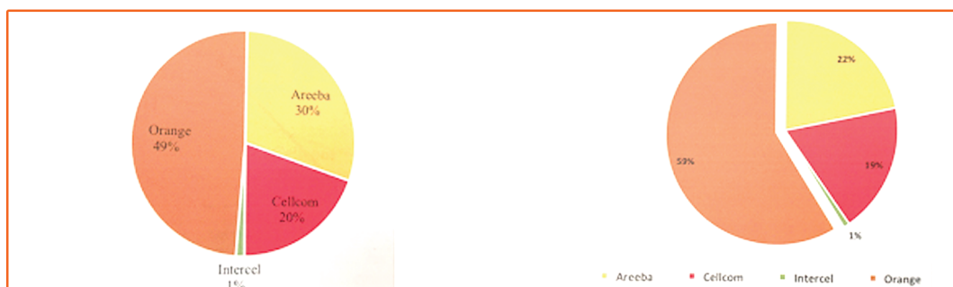
Figure 2: Part de marché volume (nombre de clients)

- 49% des parts de marché détenues par Orange Guinée avec plus de 5 millions d'abonnés dans un environnement où le taux de pénétration mobile est de 99,1% et un total de 10,765 millions d'utilisateurs de mobile. Le rapport précise également qu'Orange Guinée détient 59% des parts de marché valeur (revenus déclarés).